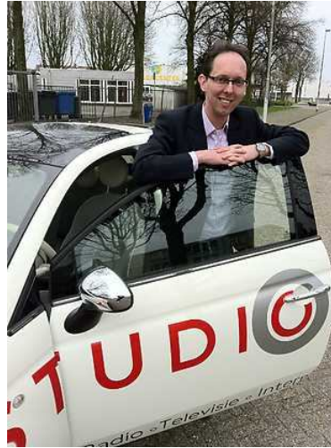
Michiel Bosgra Studio 040